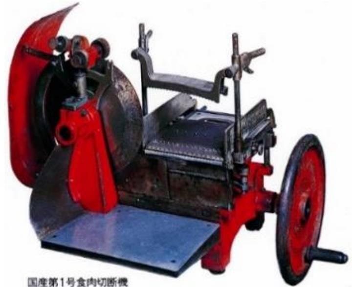
国産第1号食肉切断機