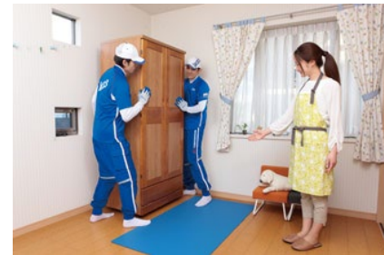
家具移動サービス